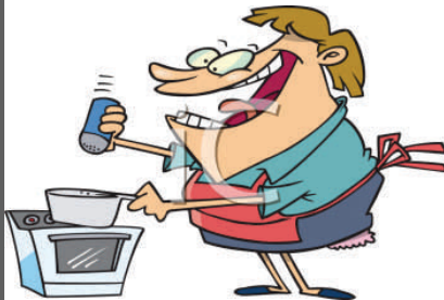
7. La madre